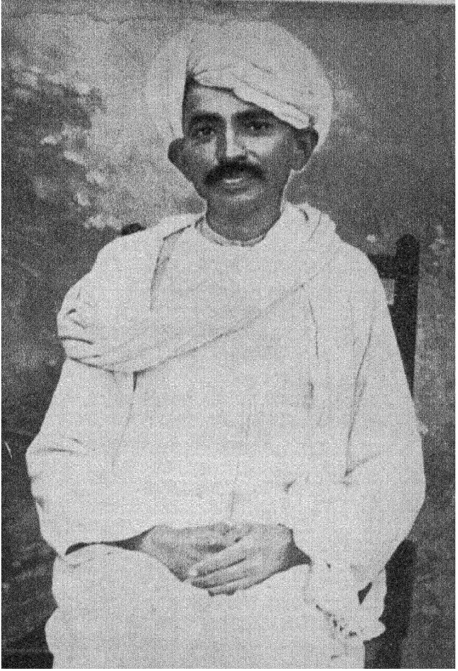
मोहनदाम करमचन्द गांधी